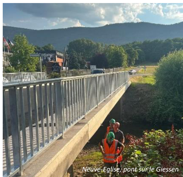
Neuve-Eglise, pont sur le Giessen