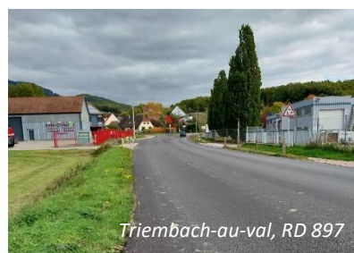
Triembach-au-Val, RD 897