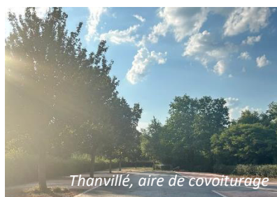
Thanvillé, aire de covoiturage